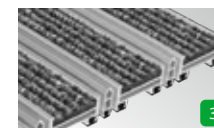
Ribbelægning og skrabeliste